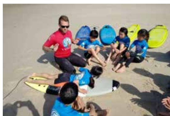
(参考：課外活動の一例、サーフﾚｯｽﾝ)